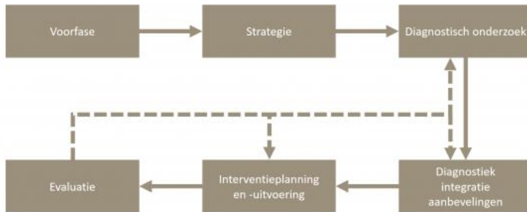
Figuur 2: Aanpak zelfverwonding ( Handelen bij zelfverwonding | CCE (Centrum voor Consultatie en Expertise) )

De eerste stap in de voorfase speelt zich over het algemeen binnen de verblijfscontext van de cliënt af, waar vastgesteld wordt dat het zo niet meer kan en er een interventie moet worden gestart. Dit kan leiden tot het zoeken van externe hulp, bijvoorbeeld een aanmelding bij CCE. In sommige gevallen wordt bij aanmelding al om de richtlijn gevraagd, in andere gevallen biedt de coördinator het bij de kennismaking aan. Hierbij wordt ook al naar de voorwaarden gekeken, waarbij de vragen worden gesteld: wat is er in het verleden al gedaan, welke mogelijkheden zijn er om het anders aan te pakken en kan de organisatie het aan. Dan volgt een intake, waarvoor beschikbare informatie (waaronder de voorgeschiedenis) wordt verzameld, de verklaringsvraag (waarom is er sprake van zelfverwonding) wordt scherp gesteld en worden de verwachtingen vastgesteld. Ook worden afspraken gemaakt over de regievoering.