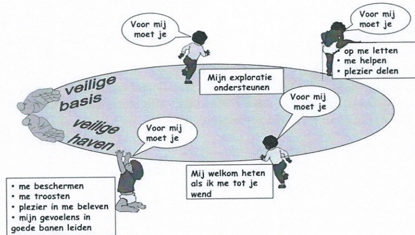
Figuur 1. Cirkel van Veiligheid (Cooper, Hoffman, Marvin & Powell, 1999).

© Cooper, Hoffman, Marvin & Powell, 1999